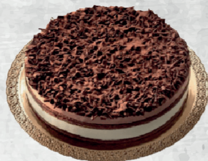
TORTA SELVA NERA/BIANCA