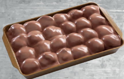
PROFITEROL CIOCCOLATO BIANCO-PISTACCHIO TIRAMISÙ-NOCCIOLA