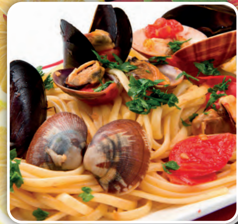
SUGO PER GRAN SPAGHETTATA