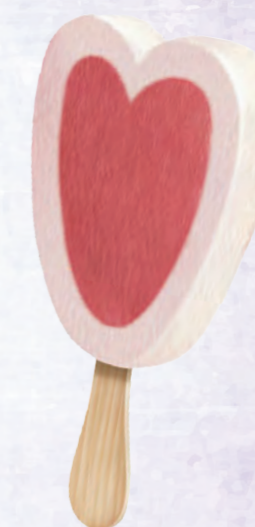
CUORE DI FRAGOLA EDO