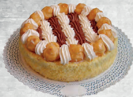
TORTA SAINT HONORÉ