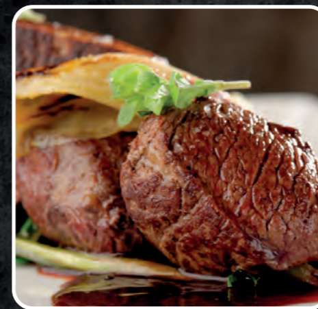
SELVAGGINA 1 Kg