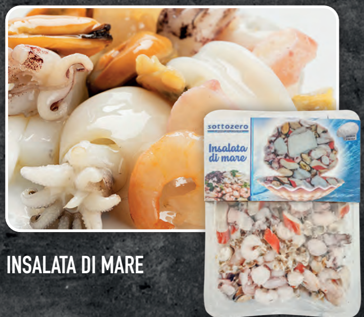
INSALATA DI MARE