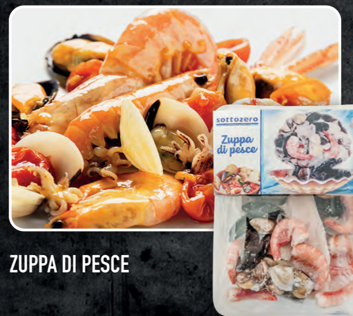
ZUPPA DI PESCE