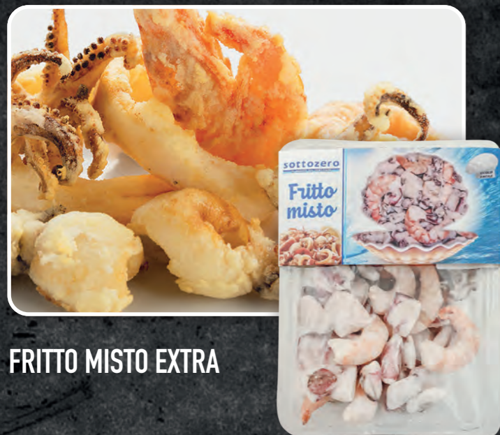
FRITTO MISTO EXTRA