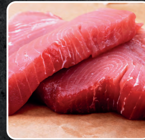
CUORI DI TONNO