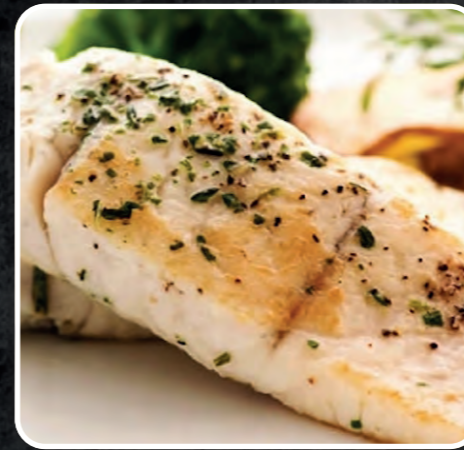
FILETTO DI BRANZINO E ORATA