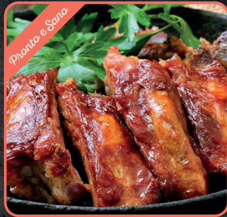
RIBS DI MAIALE

Cotti a bassa temperatura, sottovuoto. Solo da scaldare. PRODOTTI FRESCHI!