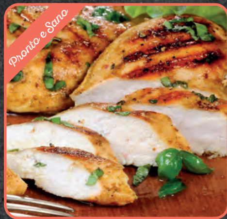
TAGLIATA DI POLLO