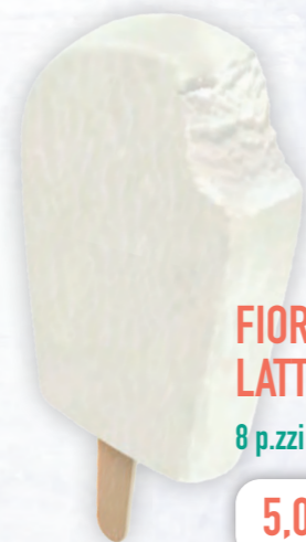
FIORDILATTE AL LATTE FRESCO