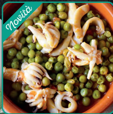
SEPPIOLINE CON PISELLI