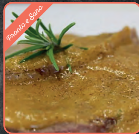
GUANCIA DI MANZO ALL'OLIO