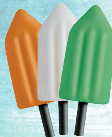
EDOMIX ARANCIA - LIMONE - MENTA