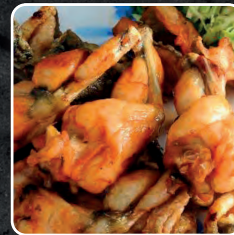
COSCE DI RANA