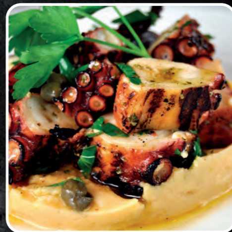
TENTACOLI DI TOTANO COTTI