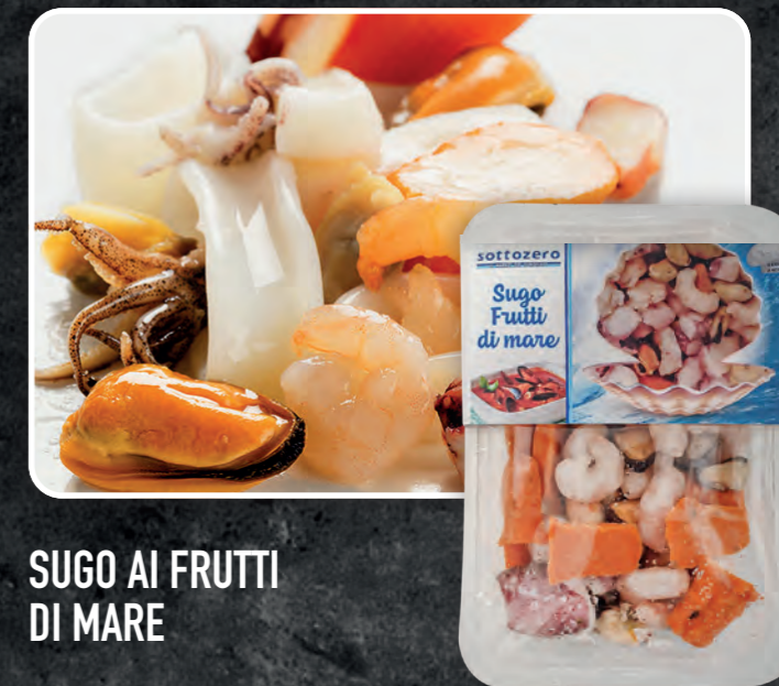
SUGO AI FRUTTI DI MARE