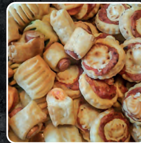
SALATINI MISTI E PIZZETTE