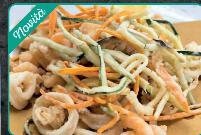
FRITTO MISTO "ORTO DI MARE" pronto da scaldare al forno