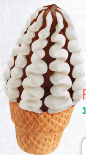
FUEGO 3 p.zzi 100 g