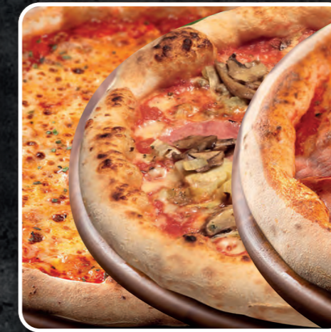
PIZZA QUALITÀ EXTRA (3 pezzi) margherita-capricciosa-speck e brie