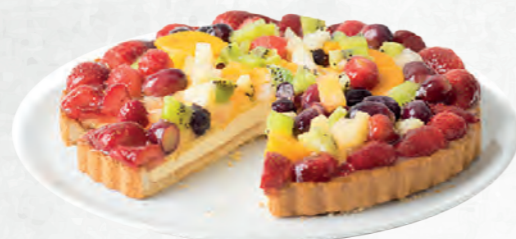
CROSTATA FRUTTA MISTA