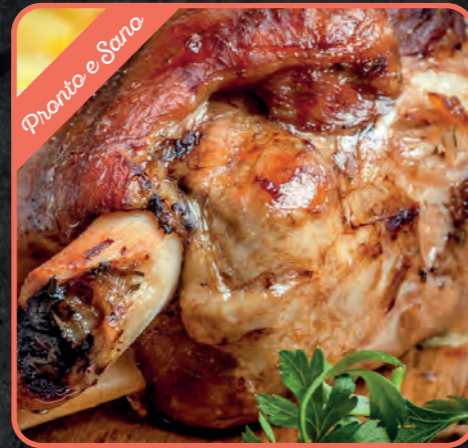
MEZZO STINCO DI MAIALE