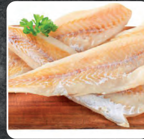
FILETTI DI BACCALÀ ISLANDA