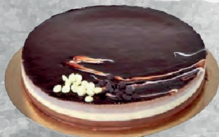
TORTA TRE CIOCCOLATI