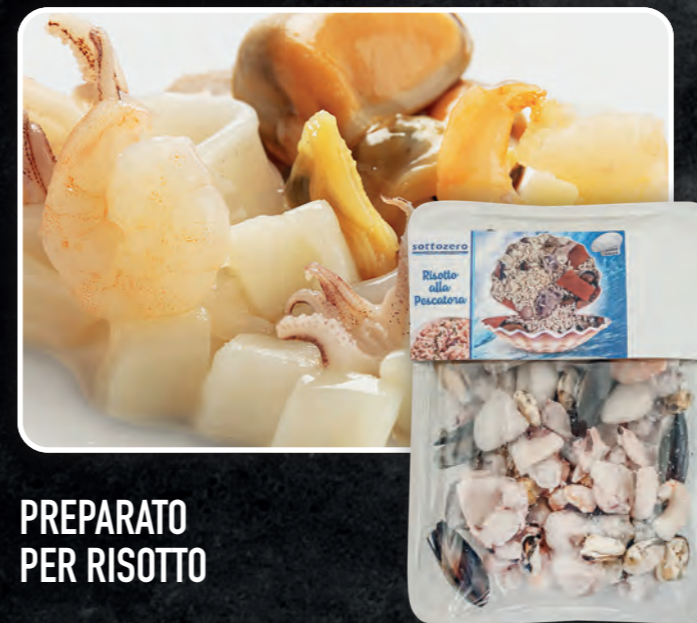
PREPARATO PER RISOTTO