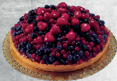
TORTA FRUTTI DI BOSCO