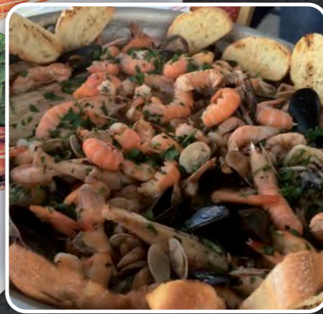
PENTOLACCIA DI PESCE