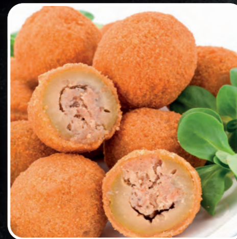
OLIVE ASCOLANE MOZZARELLE PANATE