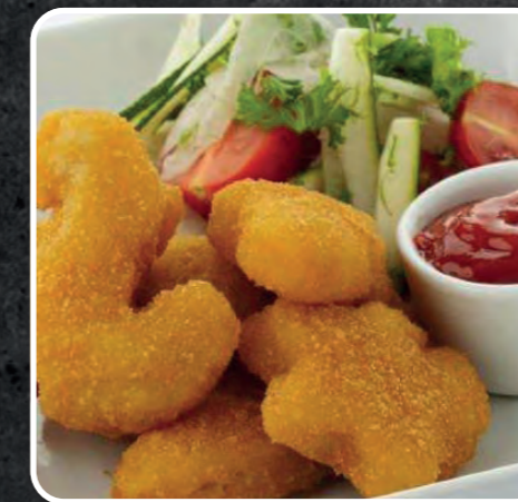
FIGURINE DI MARE