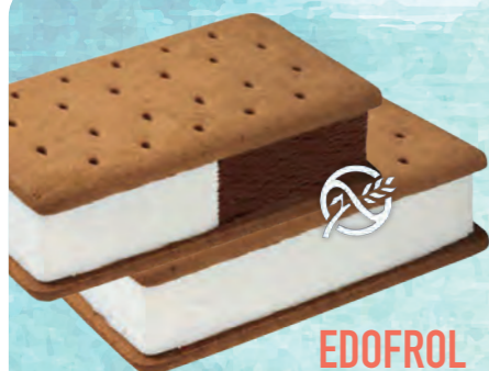
EDOFROL PANNA | PANNA E CACAO