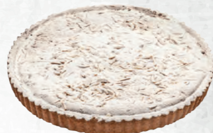
TORTA DELLA NONNA