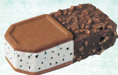
BISCOTTO MAXI SNACK